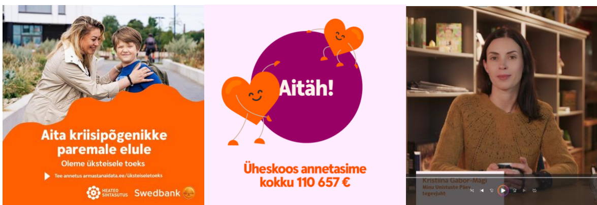
Valik 2022. aasta kampaaniate visuaale

Detsembrikuine traditsiooniline jõulukampaania kordas aasta varem lansseeritud sõnumit "Süda õige koha peal", mida täiendasid värsked videoklipid SA Kiusamisvaba Kool, SA Heategevusfond Minu Unistuste Päev ja SA Eestimaa Looduse Fond eestvedajatega. Mitmendat aastat jätkus jõulukampaania raames koostöö raadiojaamaga StarFM, kus toimus hommikumäng annetuskeskkonna tutvustamiseks ja uute annetajate kaasamiseks. Kampaaniaperioodi jooksul annetati "Ma armastan aidata" keskkonna vahendusel organisatsioonidele kokku 134 146 eurot.